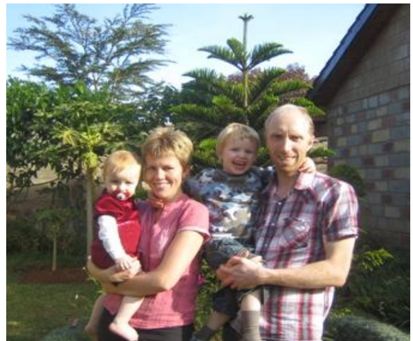
Elveberg familien i vores have