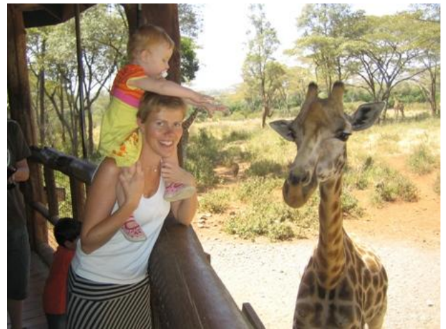
Leah vil også gerne røre den